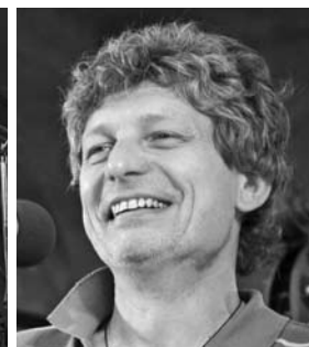
Jura z Hradišťanu