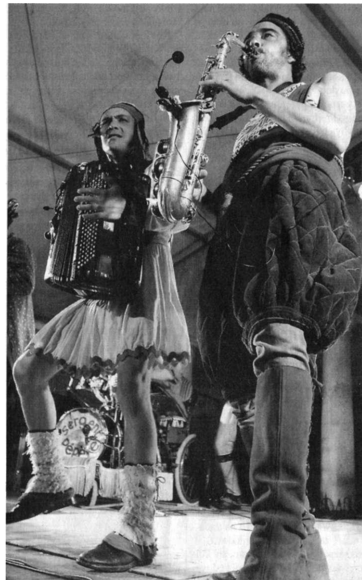
SERGENT PÉPERE. nin v Telči Francouzi.