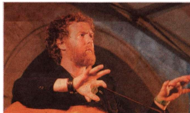
OSKAROVÝ GLEN HANSARD opakoval "nejsem žádná hvězda!" a obdivoval atmosféru Telče. Za Markétou Irglovou (i její zpívající sestrou) sem přijela i jejich rodina.

NEDĚLNÍ půlnoc patřila Sklepákům: Tomáš Hanák v italském slunečnicovém svetříku.