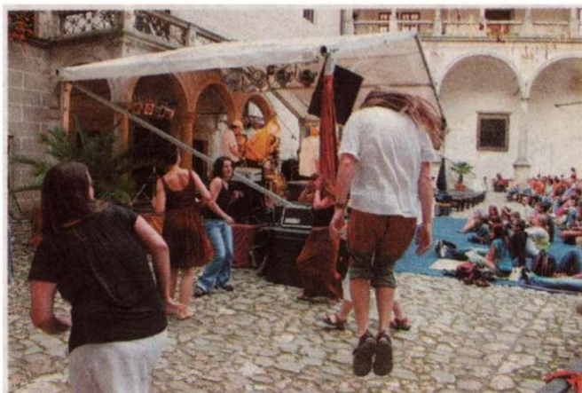
TANEČNÍ REJ na nádvoří vyvolali Čankišou.